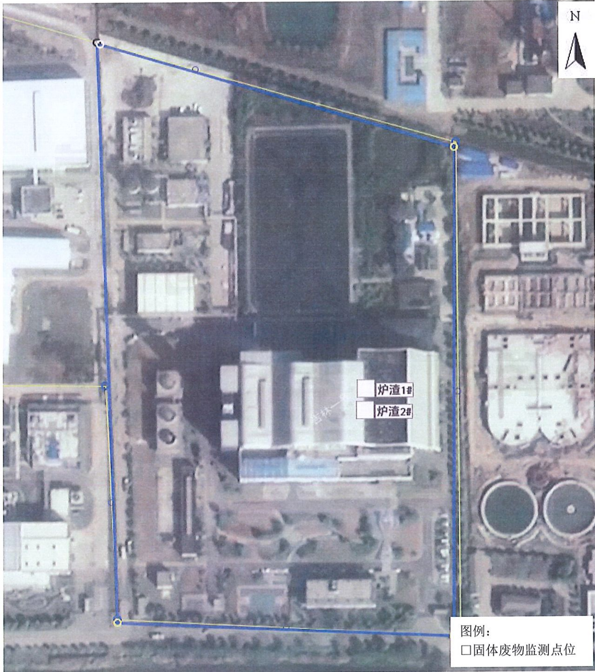
附图 1：监测点位示意图